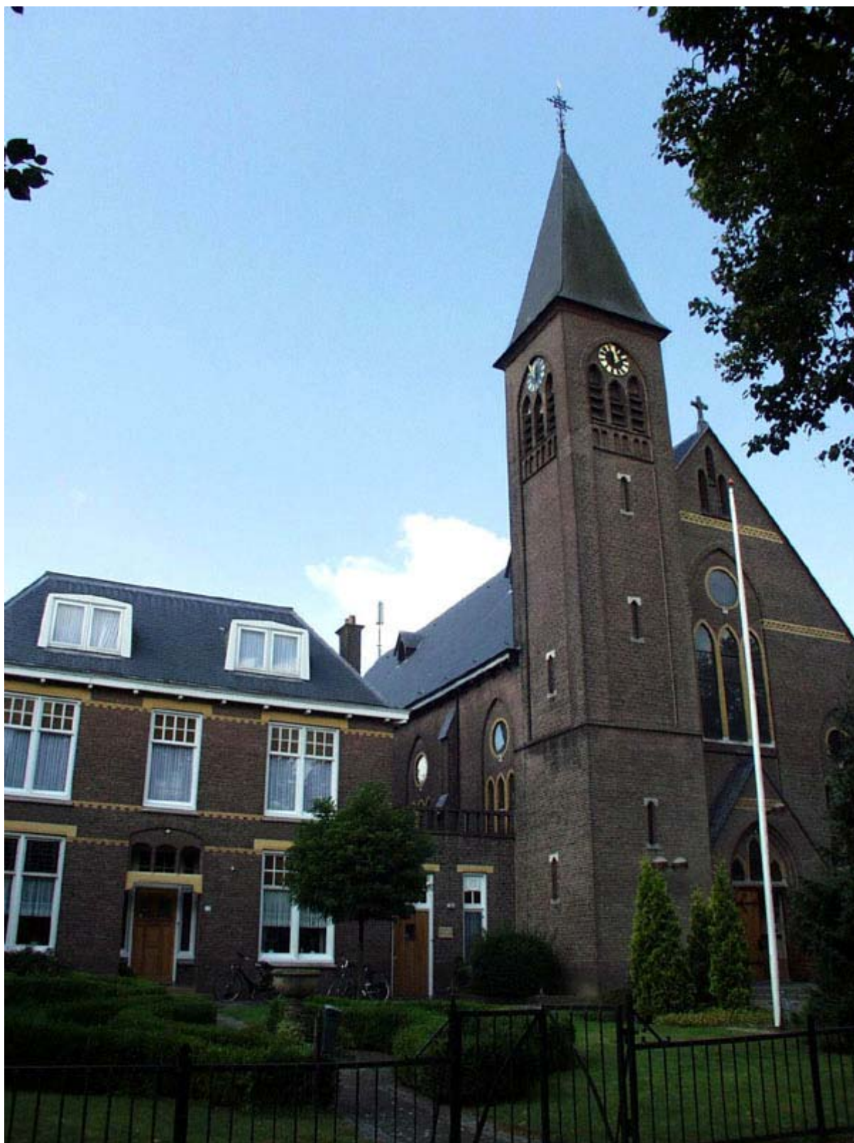
Hoofdstraat 76 - 78 7586 BV OVERDINKEL