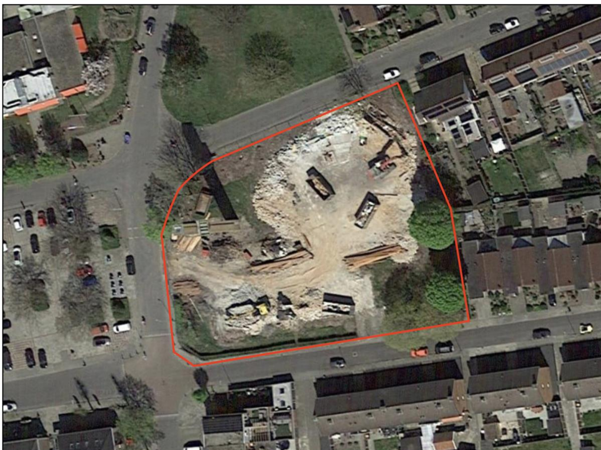
Afbeelding 3 Luchtfoto van het projectgebied

Rondom het projectgebied is geen dominante hoofdfunctie aanwezig. Maatschappelijke functies, woonfuncties, detailhandel en (openbaar) groen bevinden zich op korte afstand van elkaar.