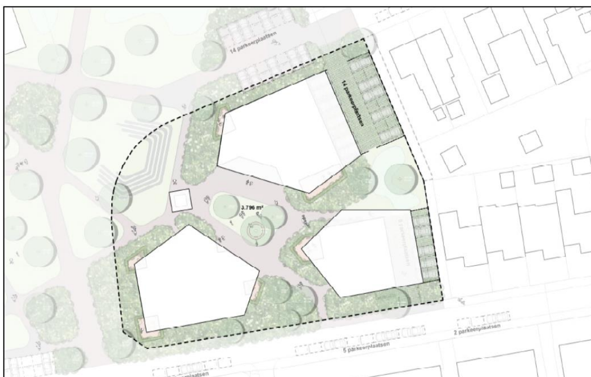
Afbeelding 2 Situatietekening gewenste situatie projectgebied

In afbeelding 2 is de gewenste situatie weergegeven.